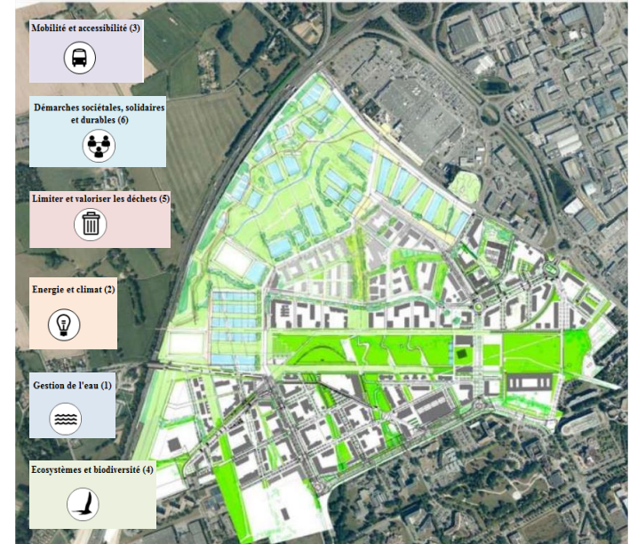
ZAC de Beauregard

Collecte d'une partie des données brutes issues de sources hétérogènes (flux open data, collectivité,...) leur intégration dans une base de données spatiales, ainsi que les traitements et croisements avec les critères d'évaluation pour produire et restituer des données riches et visuelles.